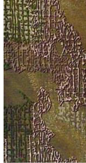
Вид 3 (Vagan ЗСУ)